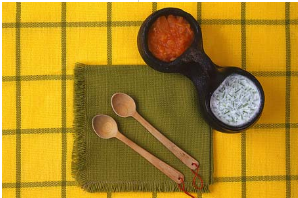
Hogao y ají de suero de la costa Caribe

foto Aponte, El Espectador , Bogotá, 30 de abril de 1992