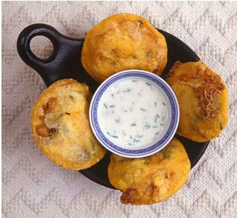
Arepas de huevo