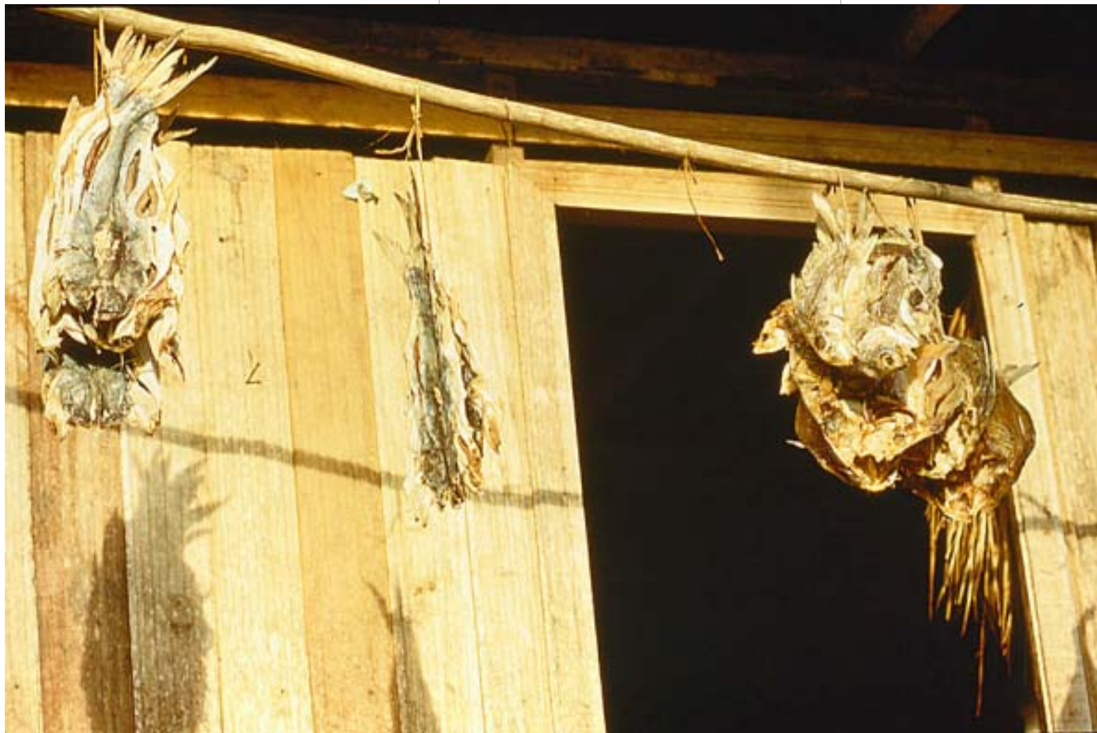
Pescado seco al sol

Puerto Merizalde (Valle del Cauca), 1991