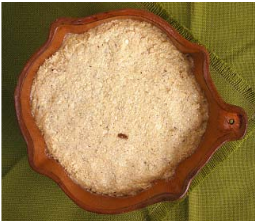
Proceso de preparación del enyucado. Una vez listo, se corta en cuadritos y se sirve como acompañamiento de platos de sal en el Caribe continental