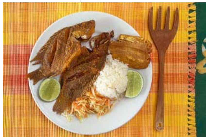
Cachama frita, arroz blanco, ensalada y patacón