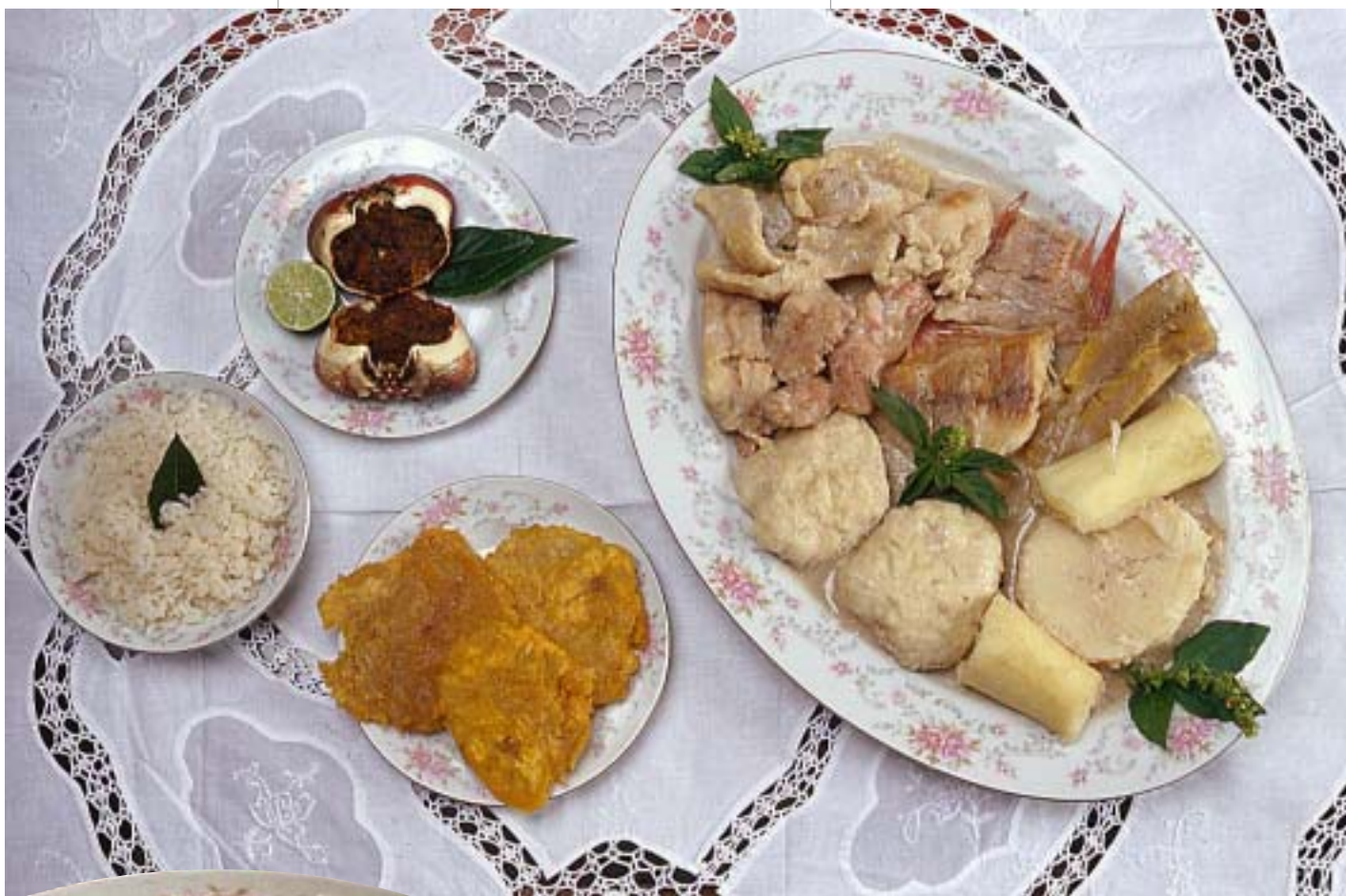
Conjunto de platos del Archipiélago

Arroz con coco (blanco) adornado con hojas de laurel