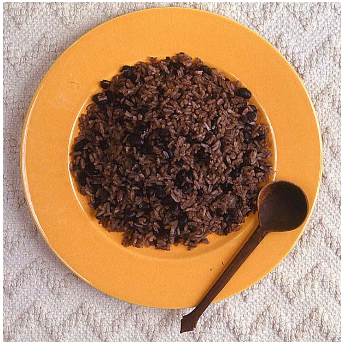
Sancocho de pescado o pusandao, propio del Chocó biogeográfico

Bebidas y refrescos. Resulta difícil enumerar la totalidad de frutas tropicales. Están el coco, mango en amplia variedad, guineo (banano), guanábana, tamarindo, guayaba, caimito, mamey, anón, naranja toronja, limón, papaya, zapote, ciruela, jobo, guinda, mamón (mamoncillo), níspero, pera roja, granada, melón, piña, patilla, cañandong, guama, uvita de playa, icaco,