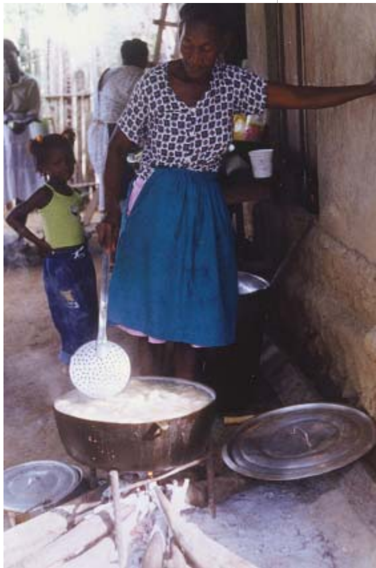
Fritanguera de San Basilio de Palenque (Bolívar)

En Haití los hacen con malanga o de bacalao, subidos de picante (ají o pimienta negra) y especias, se les conoce como acras . En Cartagena