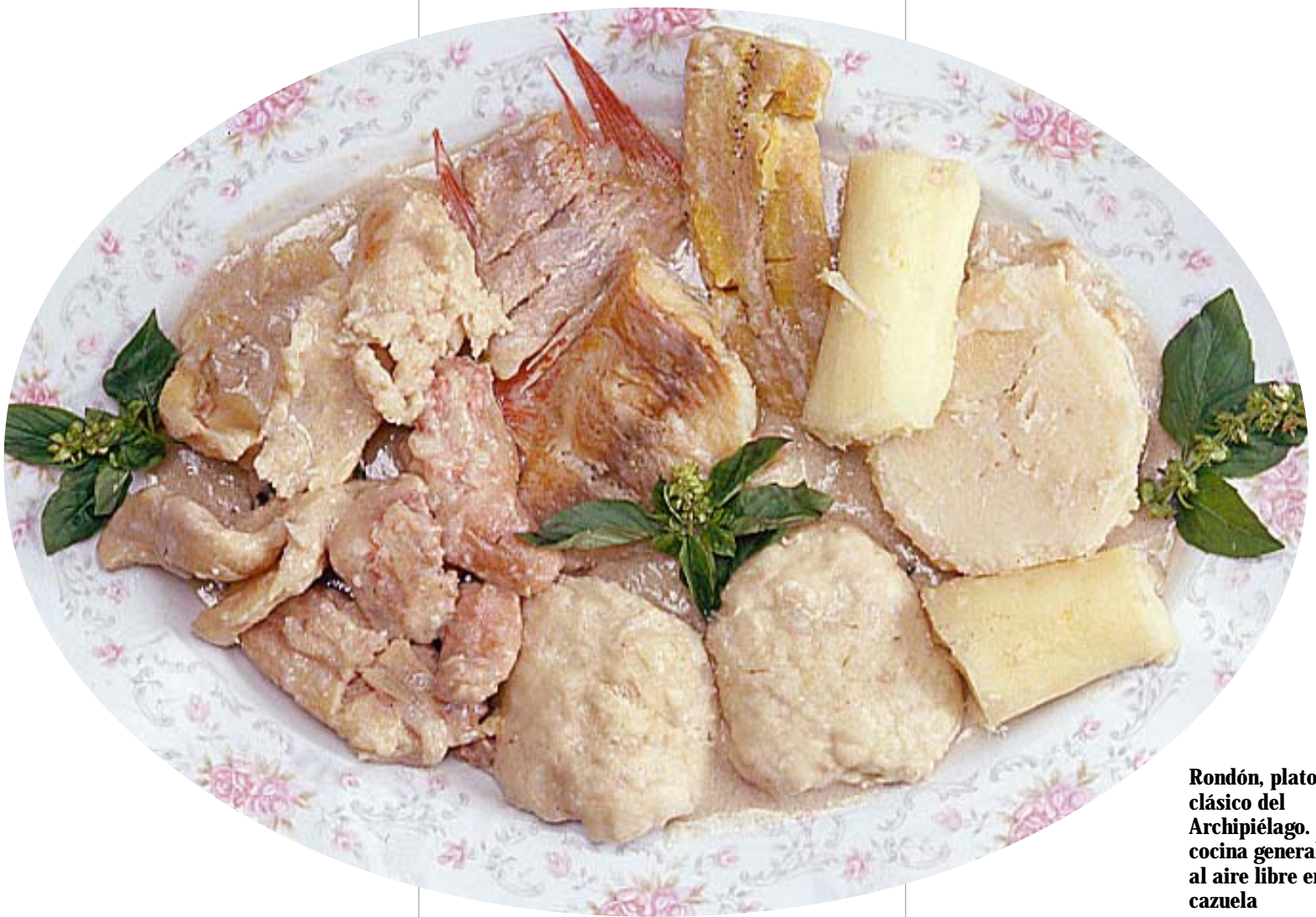
Rondón, plato clásico del Archipiélago. Se cocina generalmente al aire libre en una cazuela

< Los dumplins son muy populares en la cocina de las islas para completar guisos y sopas