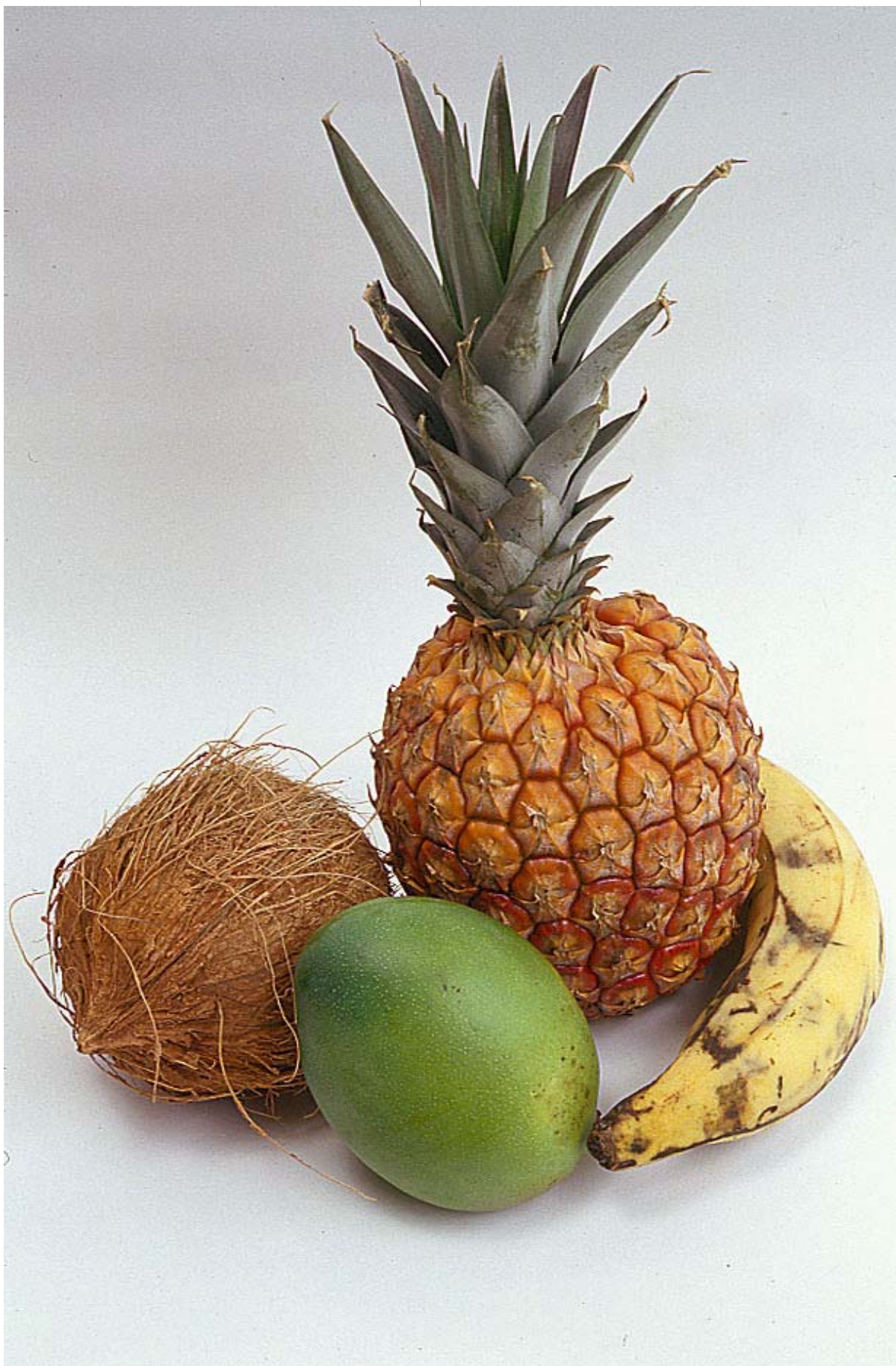
Piña, plátano, mango y coco

Los utensilios de cocina. En primer lugar se encuentra el raspador de coco, el machete, los cucharones, el picador, la piedra de moler, los cuchillos y el célebre pilón, instrumento utilizado en la preparación de granos, así como otros alimentos y utensilios muy familiares en otros tiempos. Estaba labrado en un tronco grande de madera y alto con un hueco cóncavo, donde se