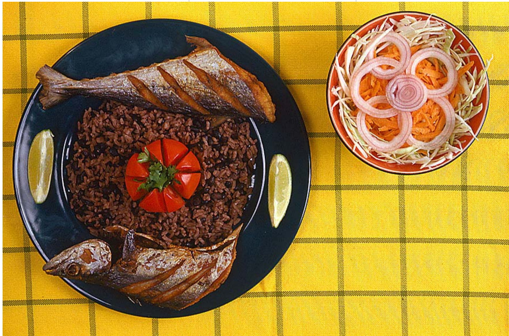
Plato tradicional de la costa Caribe: sierra frita, arroz de frijolito negro y ensalada

Durante la Colonia, el ñame llegó a América con los esclavos, al tiempo que la yuca arribó a las costas africanas. En Colombia, el consumo del ñame se extendió por todo el Caribe