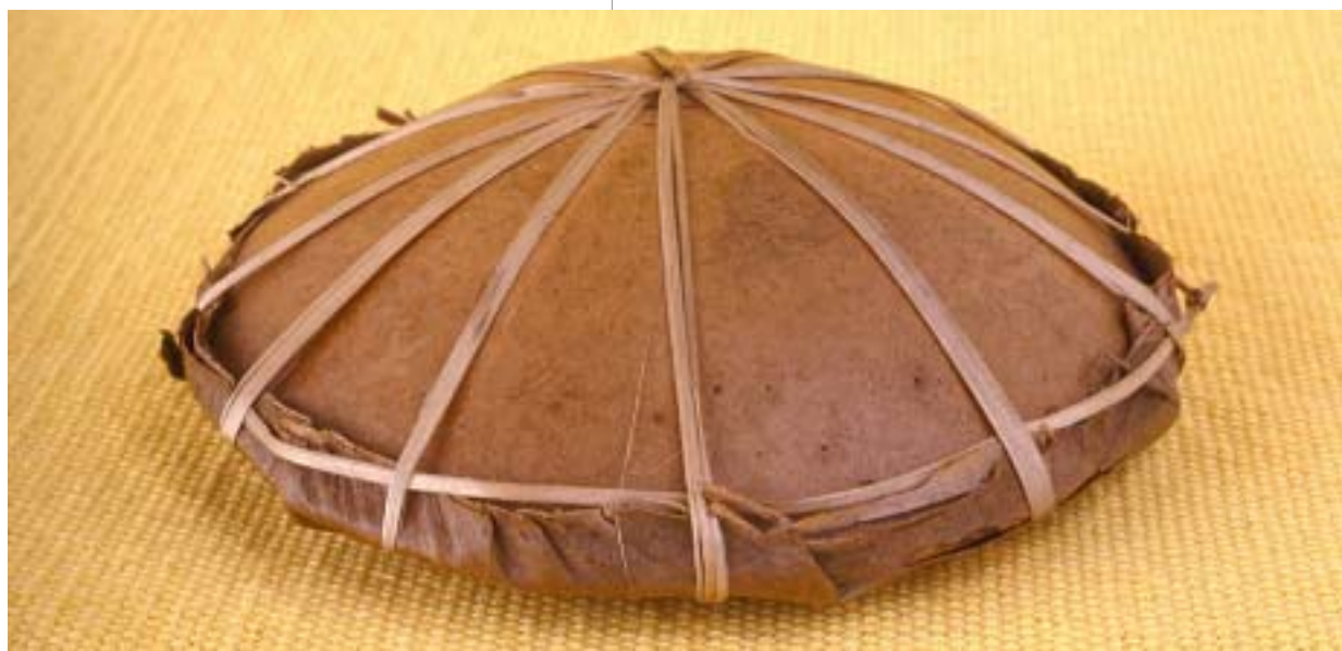
Conserva de guayaba en totumo, hoja de plátano y amarres de fibra natural