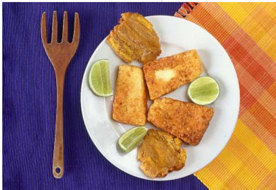
Queso frito y tostadas de patacón