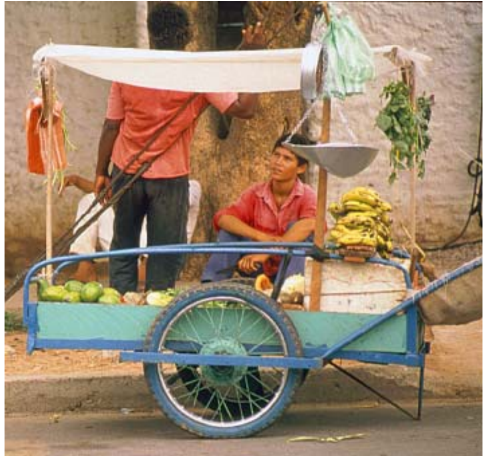
Venta ambulante de frutas en Valledupar (Cesar)

En el África occidental y central, de donde procedía la gente que llegó al puerto de Cartagena de Indias a partir del siglo XVI, predominó la agricultura extensiva, realizada con sofisticados instrumentos de labranza fabricados en hierro. Entre los más importantes estaba la azada, empleada en las labores de tala y quema. También practicaban la irrigación para lograr buenas cosechas en tierras áridas. En muchos casos estas actividades se complementaban con la ganadería.