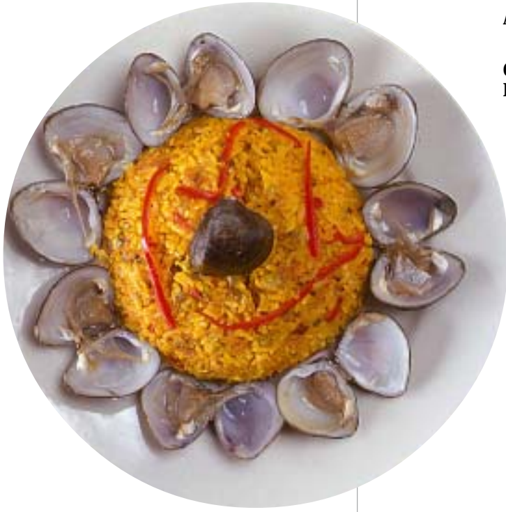
Conjunto de platos del Pacífico