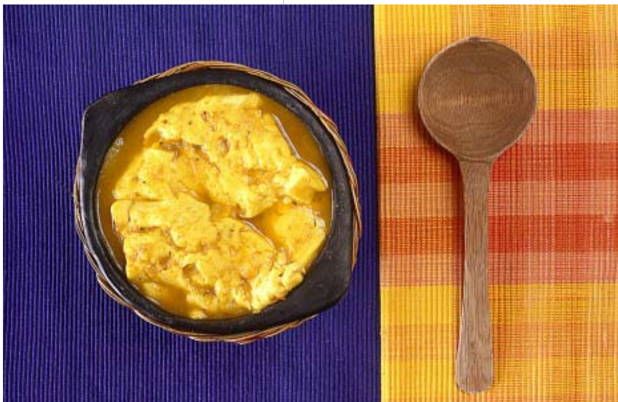
Caldo de queso, ua especialidad del Pacífico

El salpresado del pescado , luego de retirarle las tripas, se le agrega sal y se guarda en un recipiente tapado donde se conserva dos o tres días.