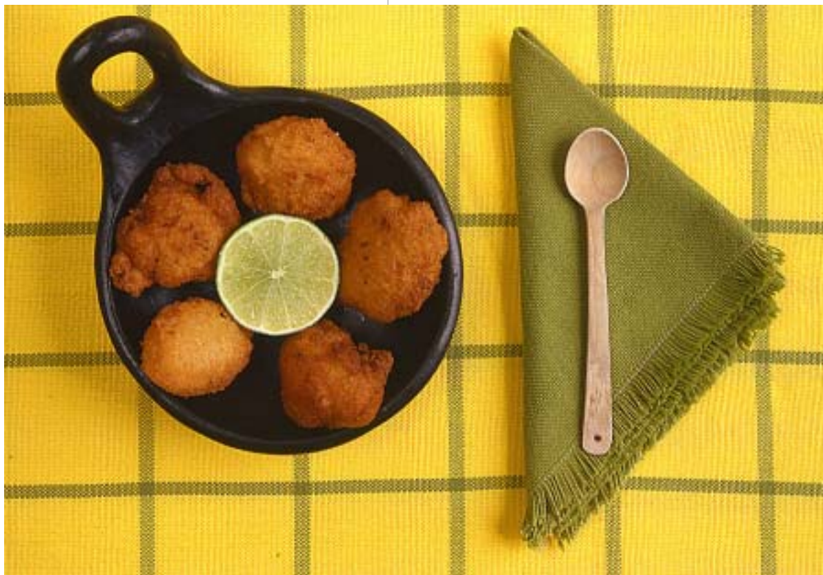
foto Humberto Pinto, El Espectador , Bogotá, 10 de diciembre de 1998