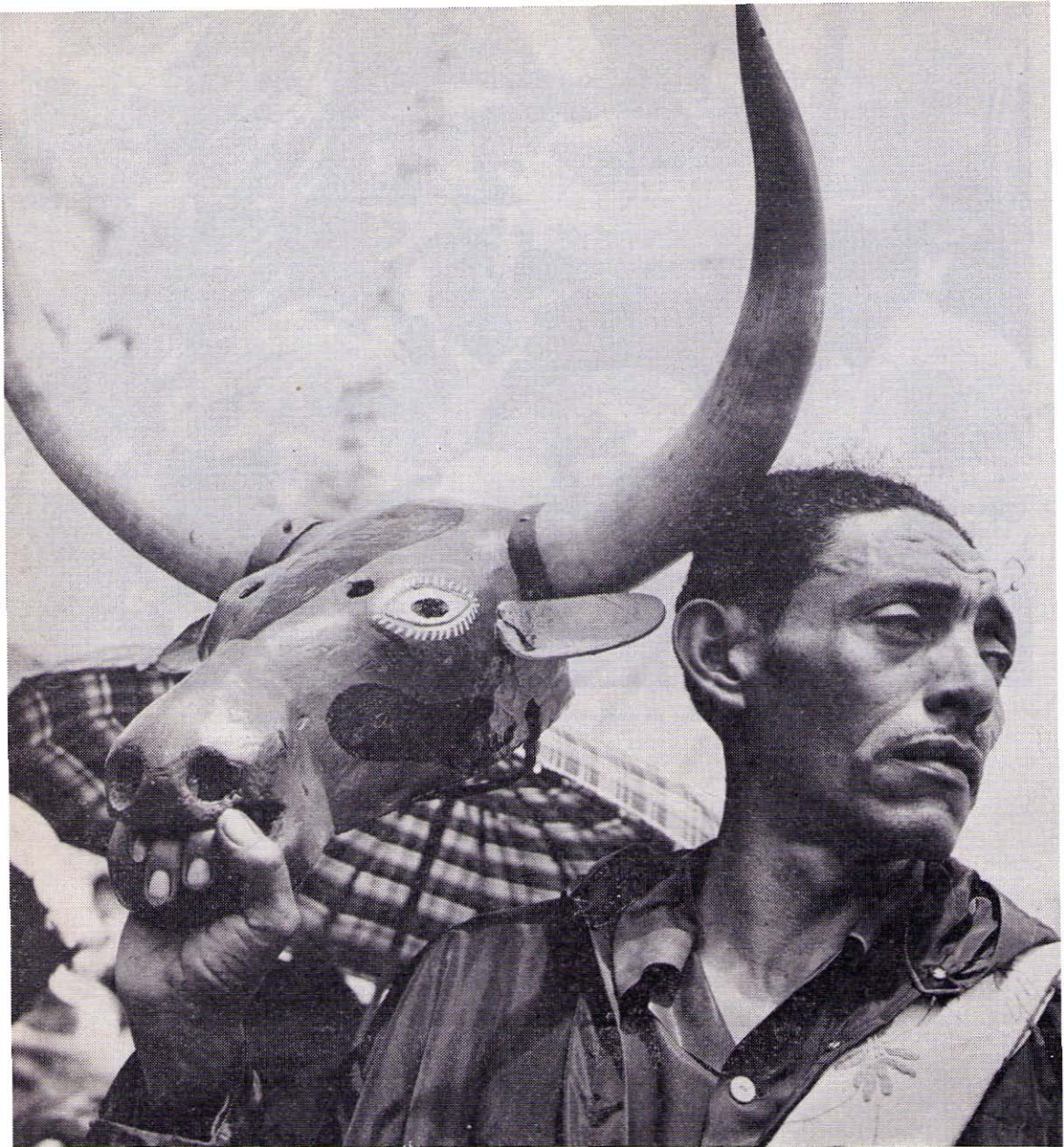
Una máscara de la danza del Torito. Hay reminiscencias africanas e indígenas.