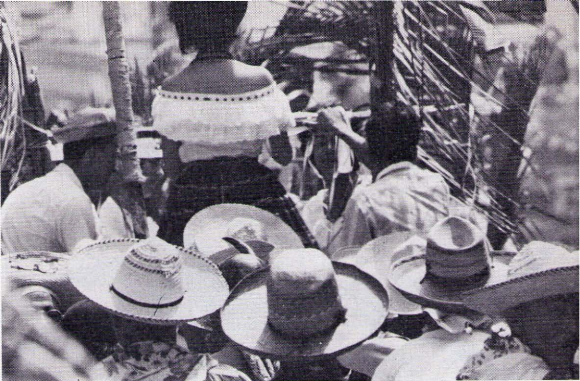
Variedades de sombreros colombianos en la Feria de Manizales.