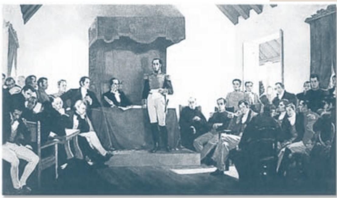
Lienco que representa a Bolívar instalando el congreso de Angostura.

La unión de Venezuela, Quito y la Nueva Granada duró poco tiempo, desde 1819 hasta 1930. El principal motivo de la separación fue el continuo desacuerdo entre los independistas criollos sobre la mejor manera de gobernar y administrar la joven nación.