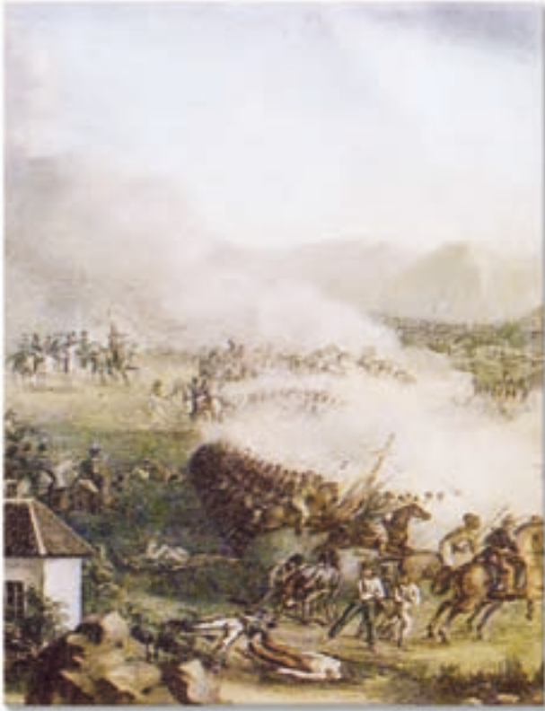
Lienco que representa la Batalla de Boyacá.

Los constantes conflictos y traiciones entre los criollos radicalizaron el movimiento independentista y dio origen a la campaña libertadora, emprendida por un ejército de hombres llaneros que el general Francisco de Paula Santander había reunido en Tame y a los cuales se sumaron los llaneros del general Páez, todos bajo el mando de Simón Bolívar.