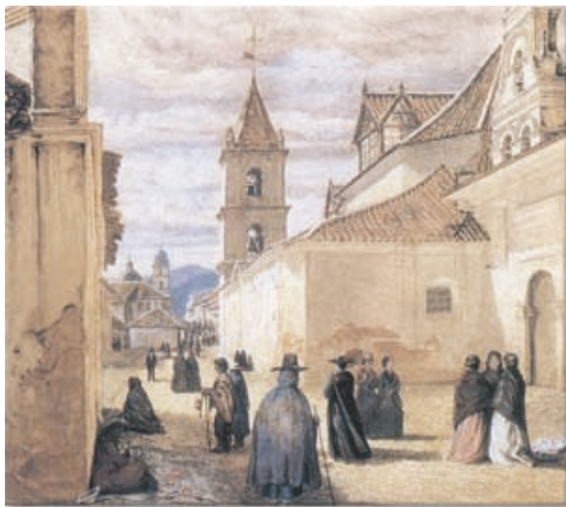
Paisaje urbano de Bogotá, primeras décadas del siglo XIX. 1

La Constitución de 1828 no logró ningún acuerdo político pero sí acentuó las diferencias entre santanderistas y bolivarianos, con lo cual se dio la disolución de la Gran Colombia en 1830 y el origen de los partidos políticos algunos años después.